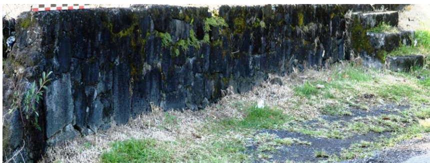
Parement de la Structure

Le port Caron est un site très ancien. En 1779, on y creuse une calle destinée à abriter des barques. Cette marine est déjà dès le XIXe dédiée aux échanges commerciaux de la localité de Sainte-Rose. Les derniers vestiges relatifs au magasin dit « magasin à varangue » ont été localisés et déclarés au Département des Recherches Archéologiques Subaquatiques et Sous-Marines le 27 juillet 2017.